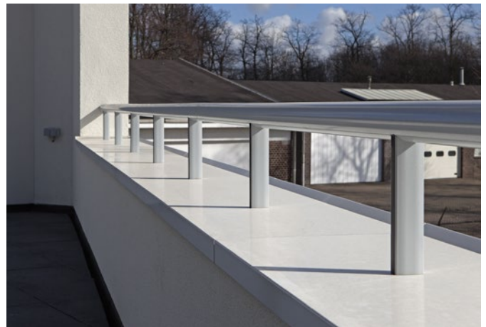
Aluminium muurafdekkappen die perfect aansluiten op het stucwerk