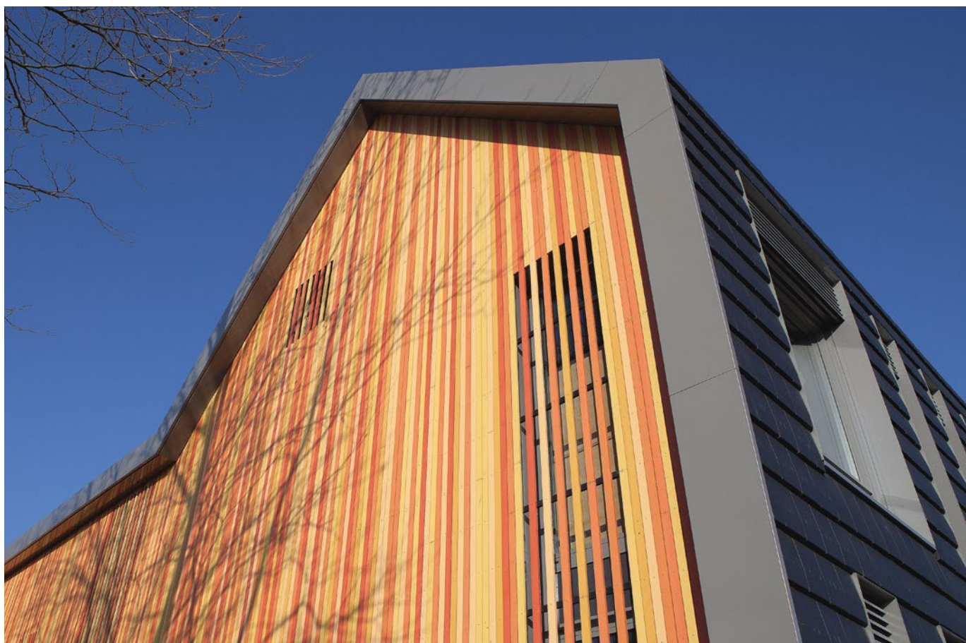
Oosterwijk, Brede School De Waterhoef, aluminium boeiboord- en overstekbekleding, muurafdekkappen en maatwerkoplossingen

Kijk voor nog meer aluminiummoois op www.roval.eu . Hier kunt u niet alleen talloze referentieprojecten bekijken, maar ook onze brochures downloaden. Tevens biedt de website allerlei mogelijkheden voor de architect, zoals het downloaden van CAD-tekeningen.