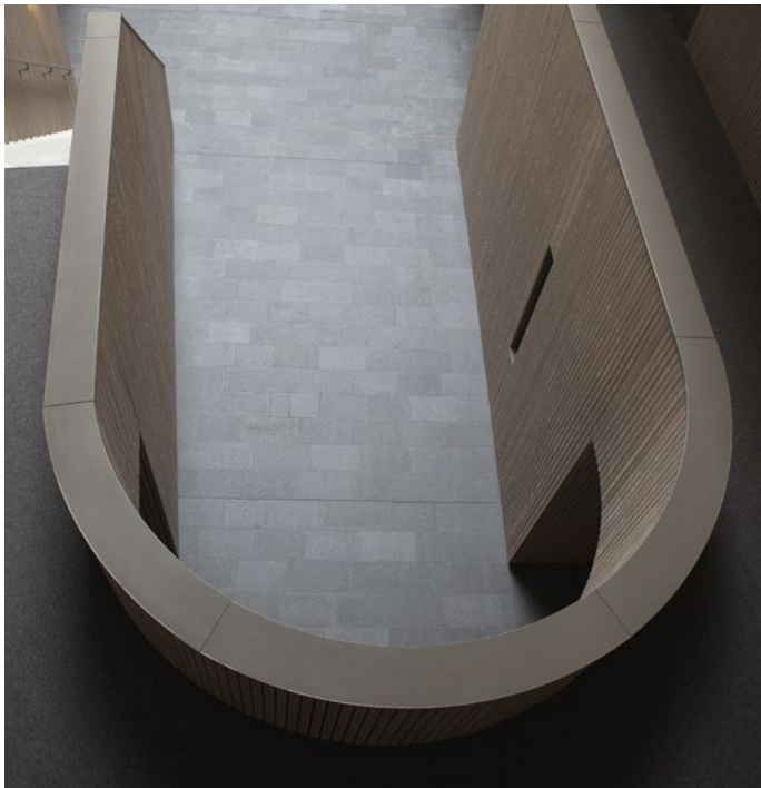
Rondgewalste aluminium muurafdekkap

Wie denkt dat de aluminium bouwproducten van Roval louter en alleen in de buitenlucht worden toegepast, komt bedrogen uit. Aluminium wordt steeds vaker toegepast als interieurelement. Dat laat het imposante atrium van appartementencomplex Stadsplein in het Tilburgse Reeshof goed zien.