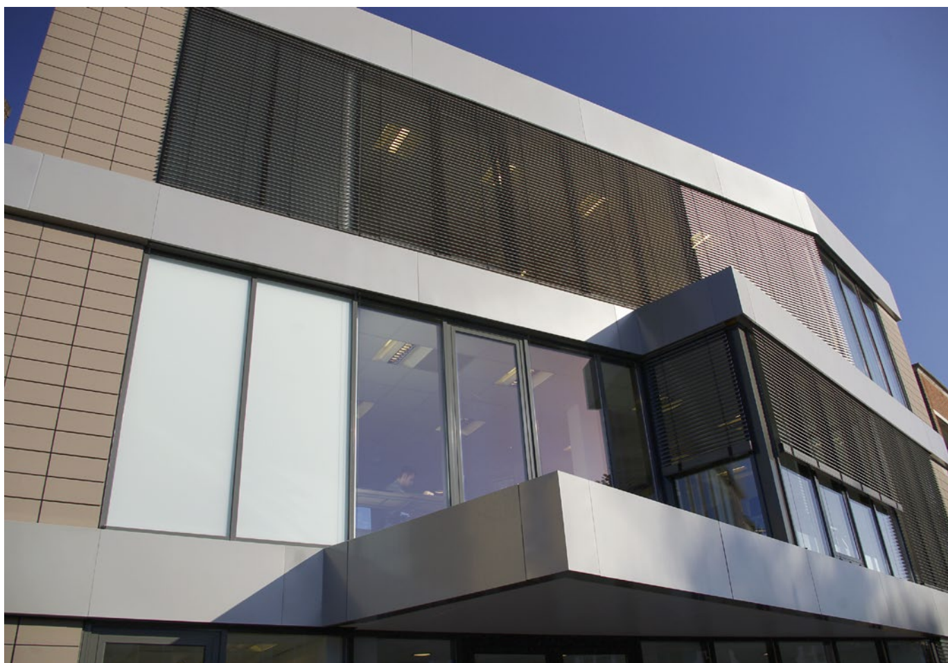
Hobij-kantoor Veghel: aluminium boeiboorden en overstekbekleding

stekbekleding, die door speling van het licht af en toe lijken op bliksemschichten. Hierdoor krijgt de gevel een zeer dynamisch karakter. Ook de toepassing van aluminium muurafdekkappen draagt bij aan de vernieuwde, esthetische uitstraling van het gebouw.