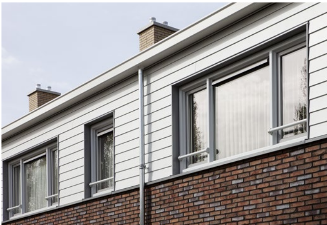
Budel, renovatiewoningen, onderhoudsarm aluminium als geveldetaillering

en door middel van een corridor aan de nieuwbouw gekoppeld. En die nieuwbouw is een prachtig staaltje architectuur, waarin diverse aluminium producten van Roval zijn geïntegreerd. De dakranden van het gebouw, dat gekenmerkt wordt door een strakke wigvorm, bestaan uit aluminium muurafdekkappen, die perfect aansluiten op het witte stucwerk van de gevels. Belangrijk esthetisch aspect: de muurafdekkappen hellen ietsjes naar binnen, waardoor de afwatering via het dak loopt en niet via de gevels, zodat er geen lekstrepen ontstaan. Ook het dakterras van de nieuwbouw wordt gekenmerkt door witte aluminium muurafdeksystemen met hierin blind bevestigde aluminium balusters. Ook deze muurafdekkappen sluiten keurig aan op het witte stucwerk.