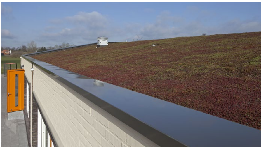
Multifunctionele accommodatie De Kolk

Hier is goed te zien dat de strakke muurafdekkap (dankzij het gepatenteerde en vernuftige klanksysteem van Roval) een fraai een-tweetje vormt met het groendak. Wellicht komt bij u de vraag op: waarom kiezen voor deze esthetische oplossing, die je toch niet ziet? Een terechte vraag, ware het niet dat veel groendaken ook betreden worden en in het geval van MFA De Kolk bijvoorbeeld, kijk je vanuit de nabij gelegen woningen direct op het groendak.