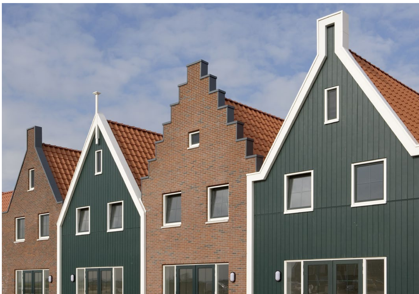
Aluminium trap-, tuit- en puntgevels in Marina Park Volendam

esthetische meerwaarde met een duurzaam karakter, strak en tot de millimeter nauwkeurig. De gemetselde rollaag of houten windveren van toen, hebben plaatsgemaakt voor aluminium maatwerk, maar dan wel met behoud van het esthetisch karakter. En om deze aluminiumlijn consequent door te zetten zijn ook de waterslagen van aluminium.